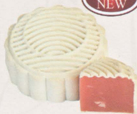
花月见 Florid Red Ambrosial

为了符合现代健康理念，富有高纤维和维生素C的火龙果混合拥有多种营养素并可抗老的蔓越莓果实，让您享用美味的月饼之余还能吃出健康饮食观念。