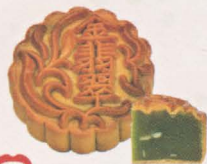
金翡翠月饼 Pandanus Mooncake

正宗经典莲蓉，配顶级咸蛋黄，百分百均选用上等湘莲，月饼烤到完美的金黄色，更显现出经典莲蓉的珍贵。