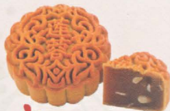
莲蓉月饼 Lotus Mooncake