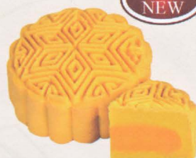
半岛金沙奶皇 Ballad of the Moon

采用上等奶王配制而成的馅料，金黄色的高尚搭配，独特的奶王香味，入口细腻得来又可口。浓郁的奶香让人爱不释手。