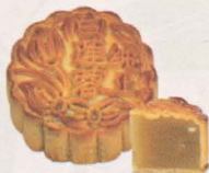
白莲蓉月饼 White Lotus Mooncake

口感细腻的香港白莲蓉，幼滑而富莲子香味，使之一口咬下，从唇齿的接触到舌蕾的感觉，细、滑、香、甜，浑然成一体，而非两相分立各扫门前雪，是另一决胜关键所在。