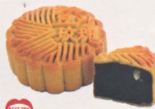
玫瑰豆沙月饼 Tau Sar Mooncake

口感细腻的香港白莲蓉，幼滑而富莲子香味，不油不腻配以顶级蛋黄，美味可口，令你回味无穷。