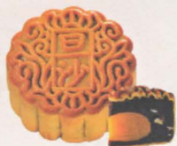
单黄豆沙月饼 Single Yolk Tau Sar Mooncake