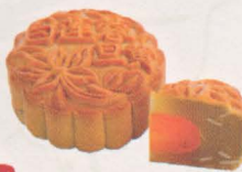
单黄白莲蓉月饼 Single Yolk White Lotus Mooncake

口感细腻的香港白莲蓉，幼滑而富莲子香味，使之一口咬下，从唇齿的接触到舌蕾的感觉，细、滑、香、甜，浑然成一体，而非两相分立各扫门前雪，是另一决胜关键所在。