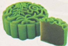
绿茶月饼 Green Tea Mooncake