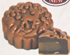
浓情缤纷 Lunar Delight

创新的榴莲搭配着香醇浓郁的白咖啡，两者谱出了一种香味俱全的完美搭配，让月饼别有一番风味。