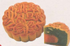
单黄金翡翠月饼 Single Yolk Pandanus Mooncake

独家调配香草班蘭内陷。浓郁的椰汁让浓浓的班蘭香味，在口中完全散，幸福满足的滋味让您念念不忘。