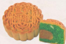
单黄椰蓉月饼 Single Yolk Coconut Mooncake