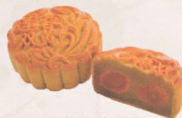
双黄莲蓉月饼 Double Yolk Lotus Mooncake

正宗经典莲蓉，配顶级咸蛋黄，百分百均选用上等湘莲，月饼烤到完美的金黄色，更显现出经典莲蓉的珍贵。