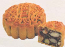
伍仁月饼 Assorted Fruits & Nuts Mooncake