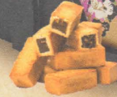
台湾土凤梨酥 Pineapple Biscuit