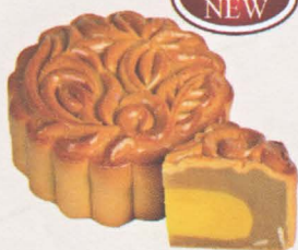
爷爷奶奶 Abuelos Harmony

创新的椰子口味特别融合独创清香的斑兰草馅料，使月饼拥有清香感觉之余还富有高营养价值，是创意特点绝对的选择！