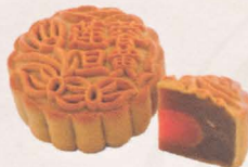
单黄莲蓉月饼 Single Yolk Lotus Mooncake

正宗经典莲蓉，配顶级咸蛋黄，百分百均选用上等湘莲，月饼烤到完美的金黄色，更显现出经典莲蓉的珍贵。