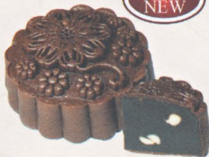
梦幻朱古力 Triple Chocolate Mania

三种不同的巧克力混合于一体引诱着人们的食欲。此馅料内含有顶级的白巧克力与黑巧克力以增加食客的口感，如此完美时尚的搭配真让人难以拒绝。