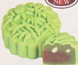
春彩月御兔 Intense Wheatgrass Jujube Splendor

具有养神补血以及排毒功效的小麦草再融合富有钙质并且滋润养颜的红枣馅，是养生的首选。